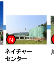
ネイチャーセンター