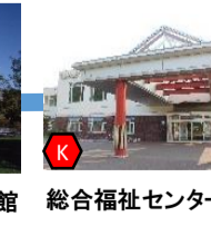
総合福祉センター