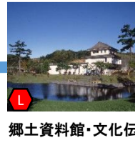
郷土資料館・文化伝承館