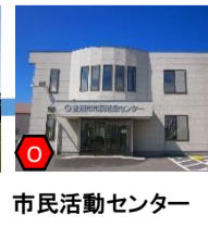
市民活動センター